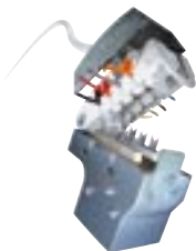
12. Modulárne zásuvky

Modulárne konektory s úchytnými, umožňujúcimi rýchle upevnenie a s jasným farebným označením pre kabeláž pre jednoduché pripojenie káblov bez špeciálnych nástrojov.