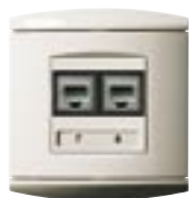
13. Nástenné zásuvky

Modulárne konektory sa upevňujú do jednoduchej alebo dvojitej zásuvky, dostupnej v rôznych dizajnoch. Štítok/Okno pre identifikáciu zásuvky. Pre povrchovú alebo zapustenú montáž v prístrojovej skrinke so 60 mm šírkou.