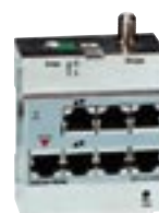
4. TV/rádiový modul

Zosilňovač, ktorý prenáša televízne a rádiové signály na sieť. Modul má vstup pre vchádzajúci kábel antény a štyri porty pre prepájanie do miestností. Existujú tri ďalšie varianty, ktoré podporujú spätnú prevádzku.