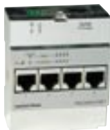
2. Dátový modul

Switch so štyrmi portami na pripojenie počítača, tlačiarne a iného hardvéru pomocou sieťových kariet. Obsahuje aj rozširovací port vo vrchnej časti na pripojenie cez uplink modul k externej sieti ako aj k širokopásmovej sieti. Modul podporuje Ethernet protokol 10/100 Base-T (10/100 Mbit/s).