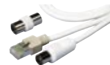
8. Pripojovacie káble

Ide o pripojovacie káble pre rádio a TV sety, dáta a telefóny.