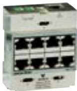
3. Telefónny modul

Vstupné telefónne linky sú pripojené pomocou telefónneho modulu - pre dve analógové alebo pre jednu analógovú a jednu ISDN linku. K dispozícii je osem portov pre vstupné pripojenie k telefónnym zásuvkám. Dostupné vo verziách - paralelne, sériovo a ISDN.