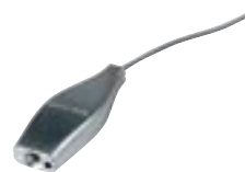
5. IR linka

Zbiera signál od vzdialeného kontrolného bodu a posiela ho k Vášmu videu, DVD alebo satelitnému prijímaču. Perfektný partner pre Váš AV modulátor - môžete kontrolovať Vaše video, DVD alebo satelitný prijímač z Vášho televízneho setu, ktorý práve sledujete, nech ste kdekoľvek v dome.